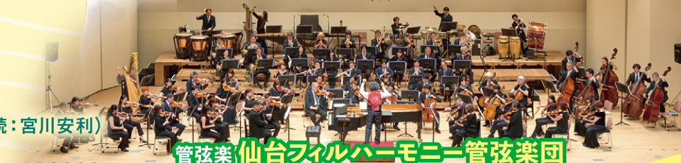
管弦楽 仙台フィルハーモニー管弦楽団